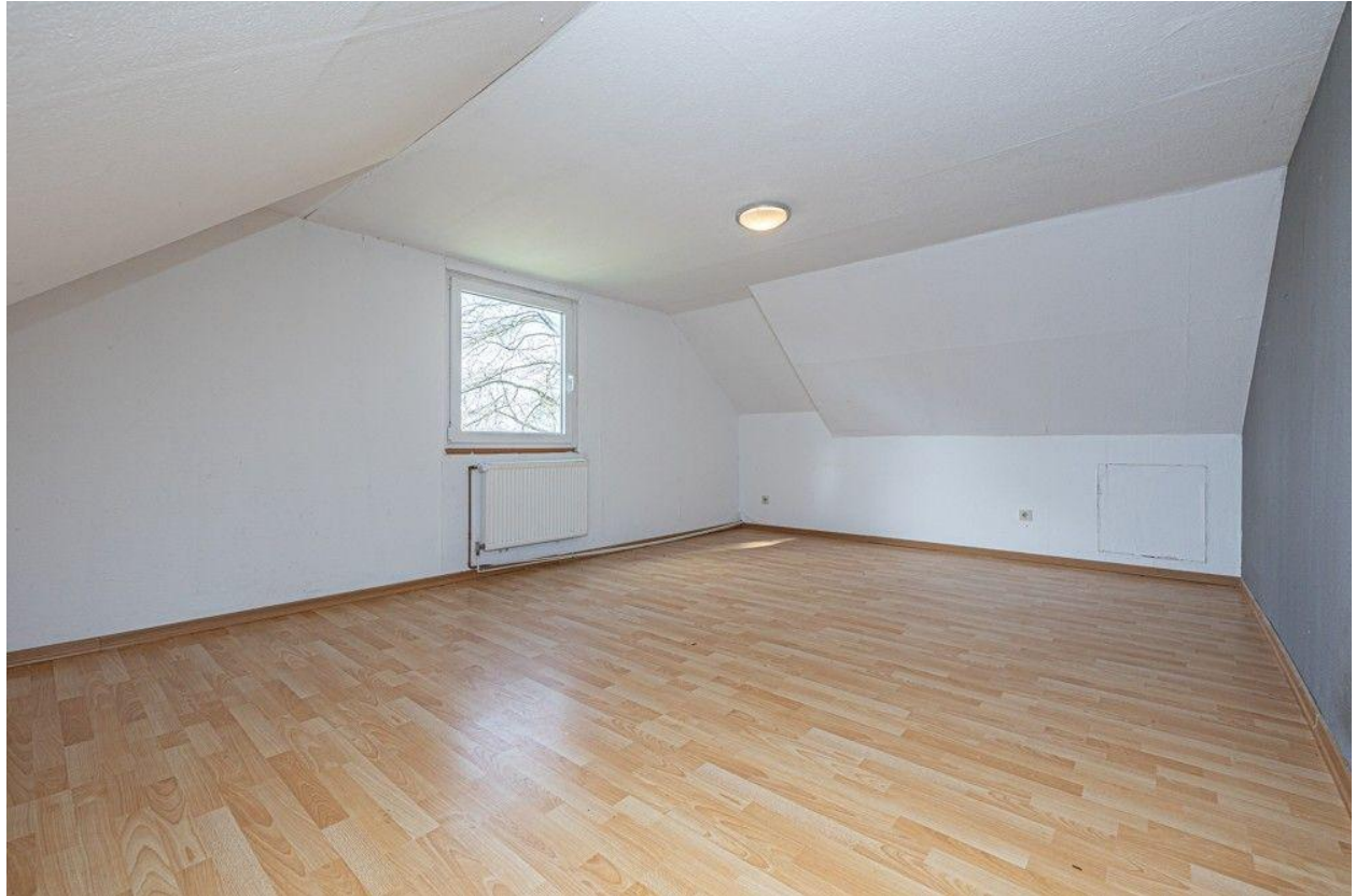
Zimmer Dachgeschoss Altenteilerhaus