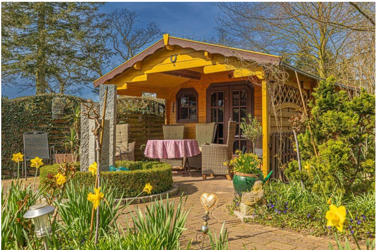
Ihr neuer Lieblingsplatz