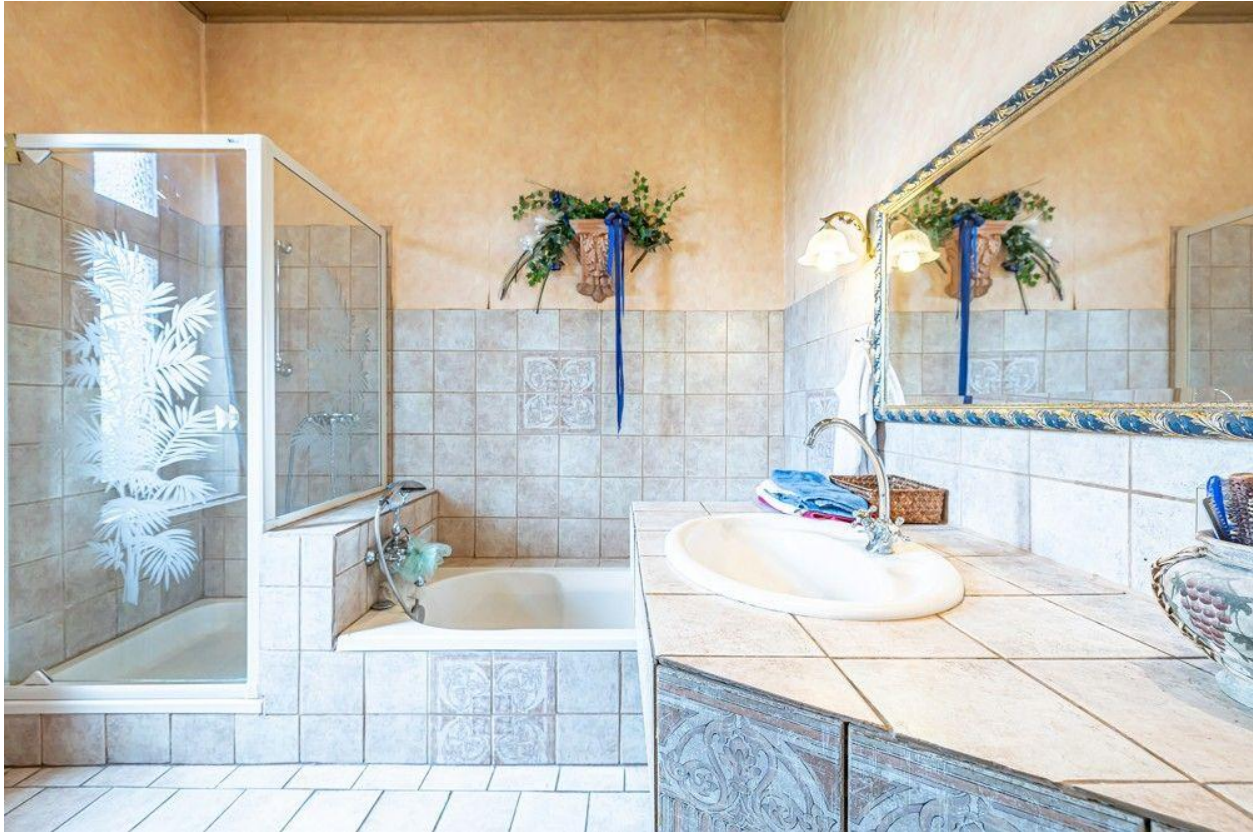
Dusch- und Wannenbad