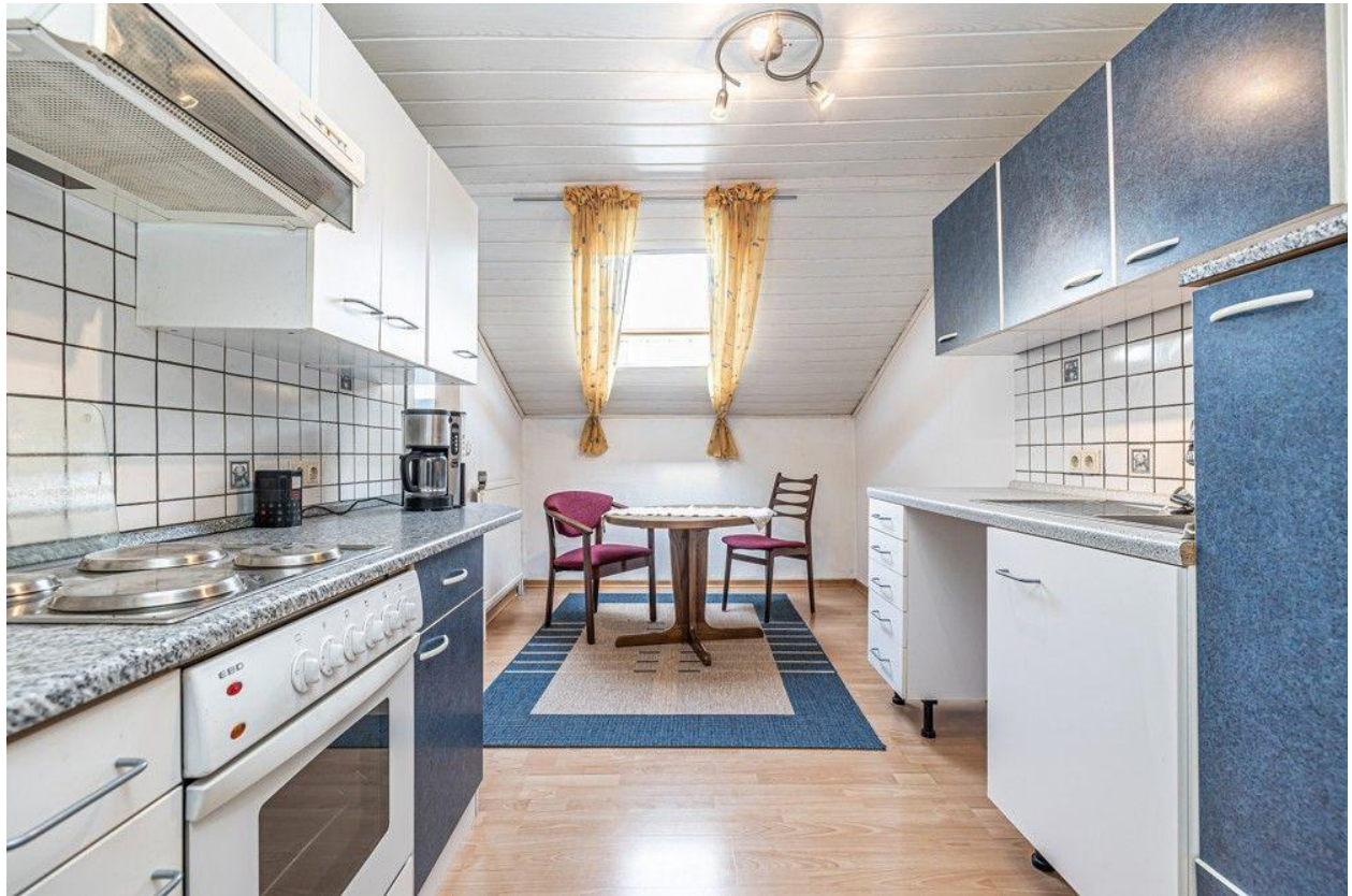
Küche OG Eigentümerhaus