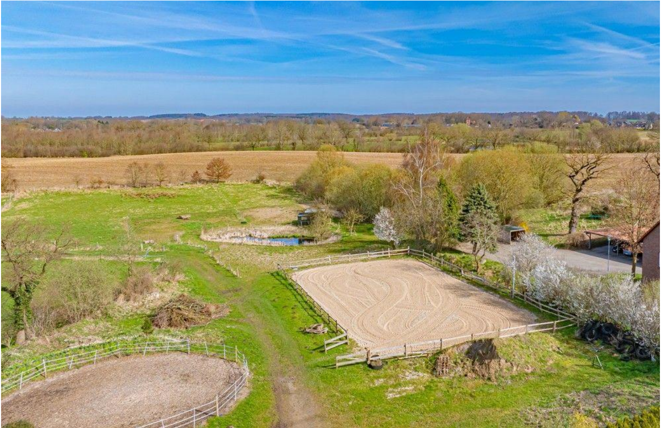
Traum für Pferdefreunde