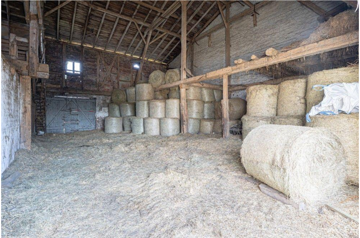
Heu- und Strohlager