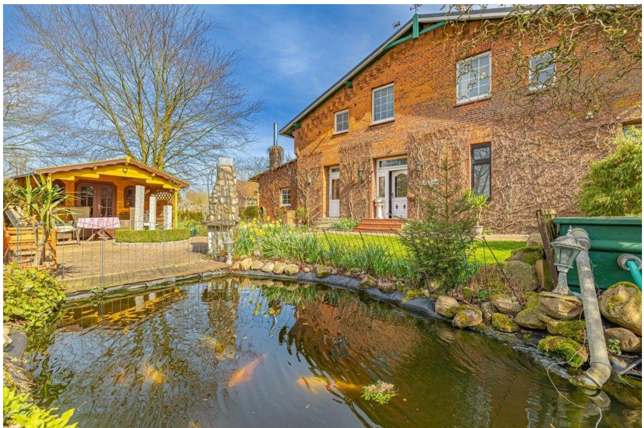
Ihr neues Zuhause