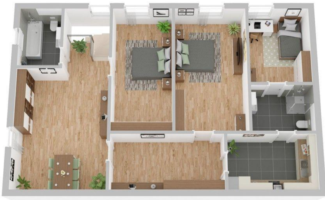
Grundriss Obergeschoss Haupthaus