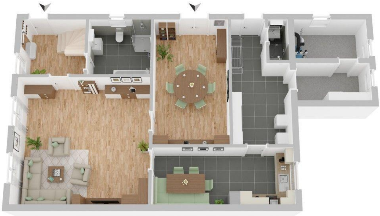
Grundriss Erdgeschoss Haupthaus