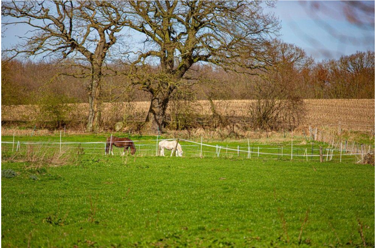
Die Pferde direkt am Haus